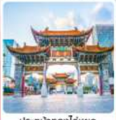
ประตูน้ำทงโก่หยก