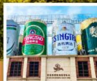
พิลส์กันที่เบียร์ชิงเต่า