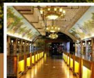
พิลส์กันที่ไวน์ชิงเต่า