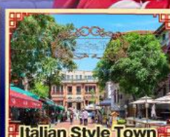
Italian Style Town