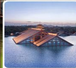
พิพิธภัณฑ์ไดโนเสาร์ กวางฟู่หลิน