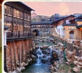
เมืองโบราณเหยาหู