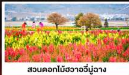
สวนดอกไม้ฮัวอวี่มู่ฉาง