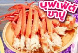
บุฟเฟ่ต์ ซาซู