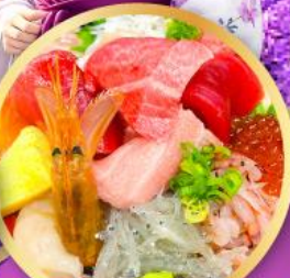
ตลาดปลาชิโมะ คาชิมะ-อิชิ