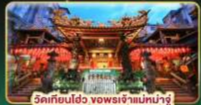
วัดเทียนโถ้ว ขงพรเจ้าแม่หน่าจู้