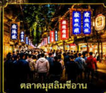
ตลาดมุสลิมซีอาน