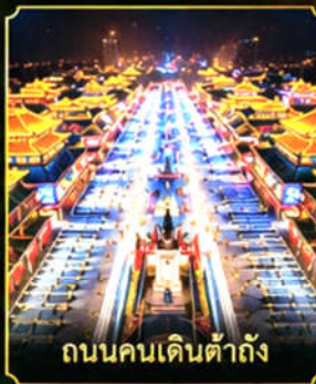
ถนนคนเดินต้าถัง