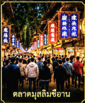
ตลาดมุสลิมซีอาน