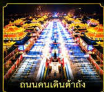
ถนนคนเดินต้าถัง