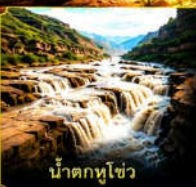
น้ำตกหูโซ่ว