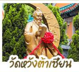
วัดเว้งต้าเซ็ง