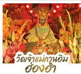
วัดเจ้าแม่กวนอิมอ้องฮ้า