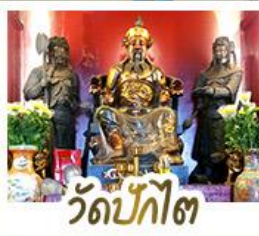
วัดปี้กั๊ต