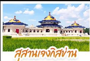
สุสานเจกิสถาน