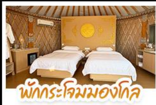
พักโรงแรมมองโกล

เที่ยวสบาย นอนหรูระดับ 5 ดาว เปลี่ยนลุคเป็นสาวมองโกลสุดชิค! ทริปนี้จัดให้แบบ V.I.P. เปิดประสบการณ์ พักโรงแรมมองโกลสุดพรีเมียม พร้อมนั่งกระเช้าและขี่อูฐไปตะลุยเนินทรายสีงาชาวาน เก็บครบทั้งไฮโซดและสุสานเจกิสถาน