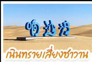
มินิทรายเสียงชาวาน