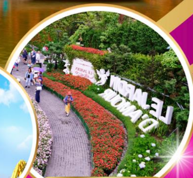
Le Jardin d'Amour