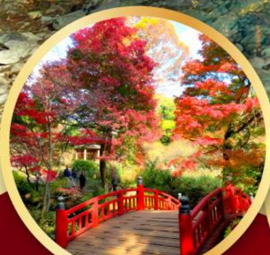
สวนดอกบ๊วยอาคาบิ