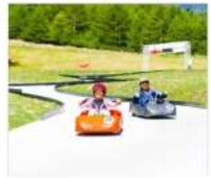
กิจกรรมขับโกคาร์ท