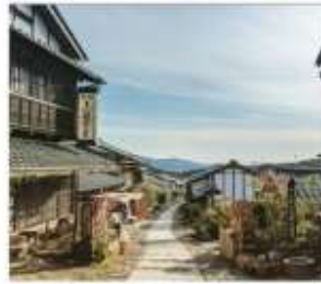
มาโกมะจุกุ