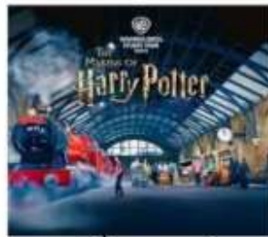
แฮร์รี่ พอตเตอร์ สตูดิโอโตเกียว