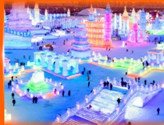
เที่ยว ICE & SNOW WORLD