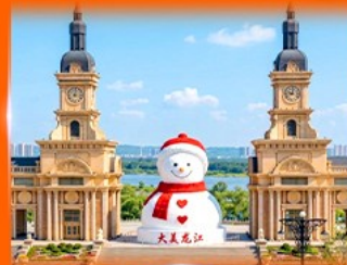
ตึกคาทอลิกฮาร์บิน