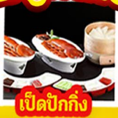
เปิดปีกกิ้ง