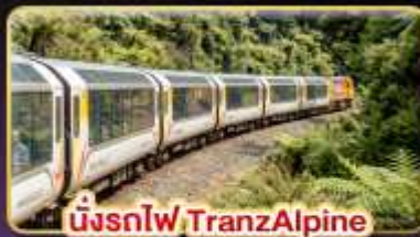
นั่งรถไฟ TranzAlpine