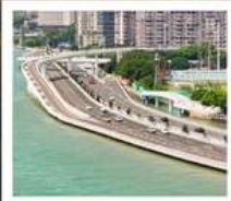
สะพานเหยียนหฺวู่เฉียว