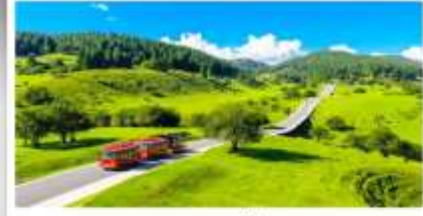
เวนางฟ้า

เดินทางโดย: สายการบินดงซิ่งเจียงเป่ย์ (PN)