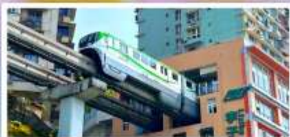
รถไฟฟ้าลู่ติ๊ก