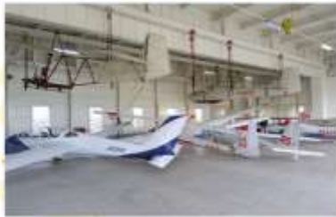
TAKIKAWA SKY PARK MUSEUM