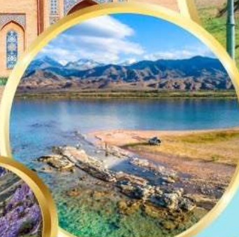
ล่องเรือทะเลสาบอิสซิค