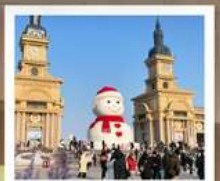
ตุ๊กตาคิมะยักซ์