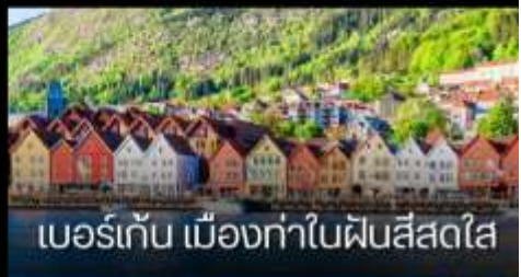
เบอร์เก้น เมืองท่าในฟินส์สไต