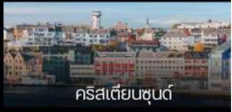
คริสเตียนซุนด์