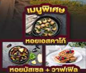
เมนูพิเศษ หอยเอสคาโก้ หอยมัสเซล + วาฟเฟิล