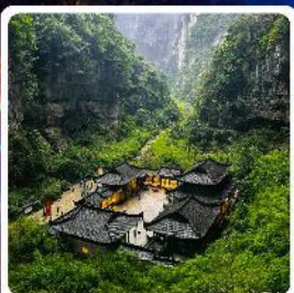
อุทยานแห่งชาติหลุมบ่อฟ้า