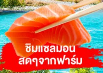
ชิมแซลมอน สดๆจากฟาร์ม